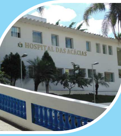
Hospital das Acácias