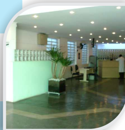
Hospital Santa Clara