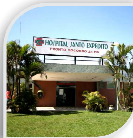
Hospital Sto. Expedito