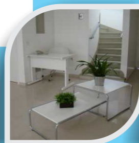
VIPClin Santo Amaro