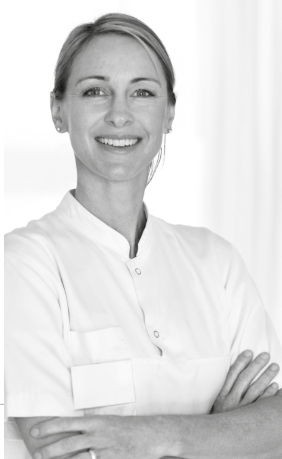
Tabela de preços e rede credenciada